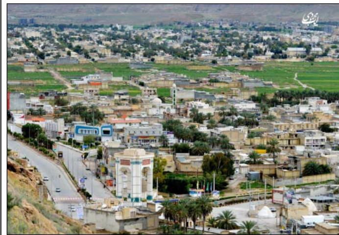
عکاس: ایوب محمودی، ۱۳۹۴