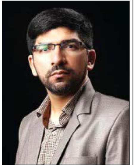
متولد ۱۳۶۲ - لیسانس مهندسی عمران شاغل در شرکت فنی مهندسی، مربی حق‌التدریس فنی و حرفه‌ای لارستان