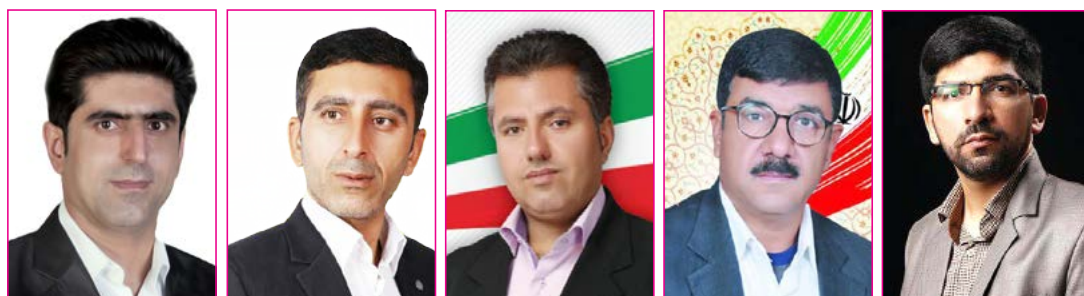
آنچه مردم در پای صندوق‌های رای رقم زدند