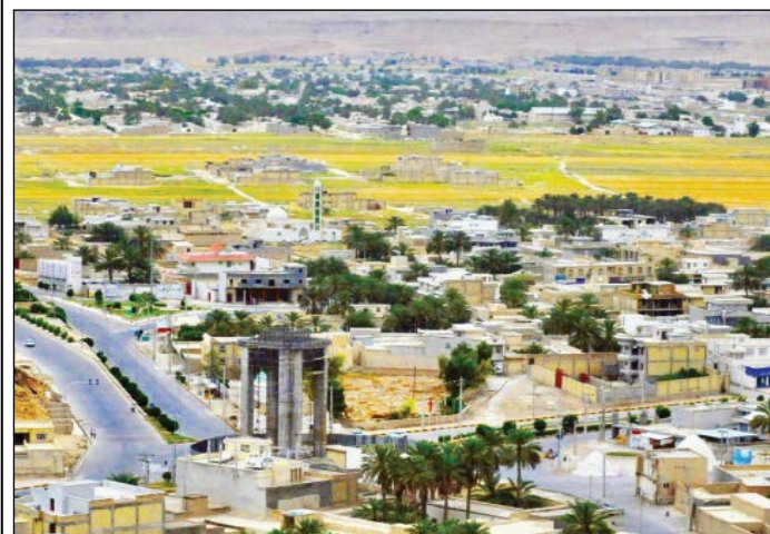
عکاس: عبدالسلام مهرآوران، ۱۳۸۹